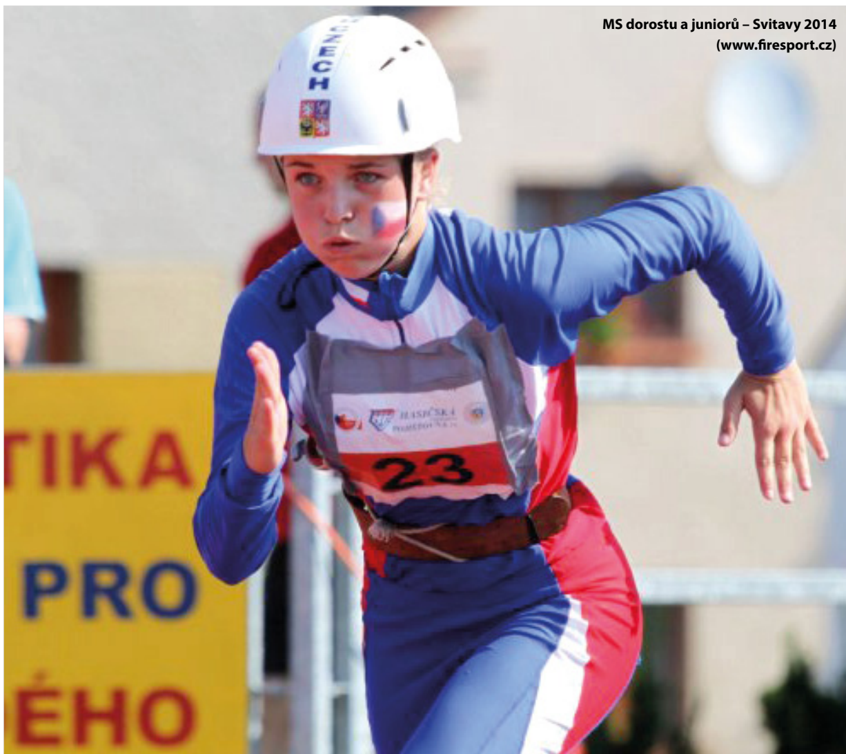
MS dorostu a juniorů – Svitavy 2014 (www.firesport.cz)

Očekávaná účast je 50 až 60 družstev sportovců z 16 až 20 zemí světa , tedy na 600 závodníků a členů realizačních týmů . Akci pomůže zajistit více jak 100 dobrovolníků především z řad členů Sdružení hasičů Čech, Moravy a Slezska , kteří se zachovali skvěle a bezprostředně poté, co bylo o konání akce u nás rozhodnuto, se sami hlásili jako